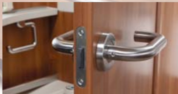
Porte cabinet de toilette: La serrure à clenche sur la nouvelle porte du cabinet de toilette est en Grivory GV-5H, une des matières plastiques les plus résistantes qui lors de tests internes a générée des traces de guidage dans le métal sans pour autant montrer de trace d'usure