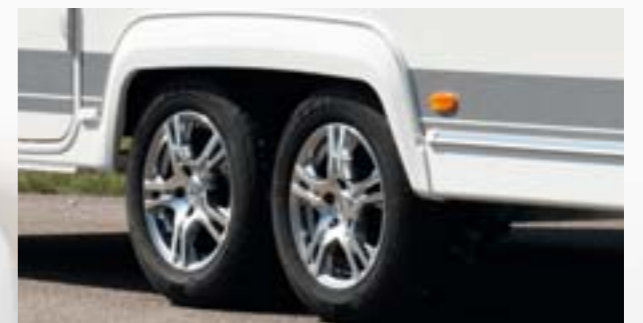
Jantes aluminium haut de gamme