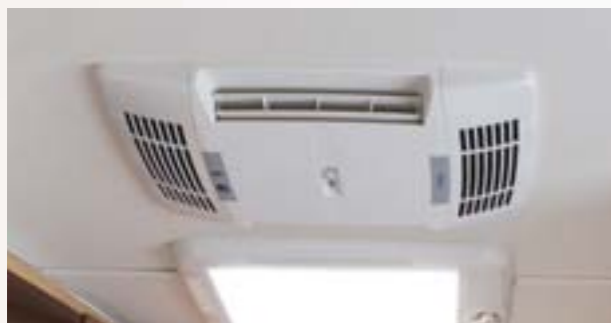
Climatiseur B 2200 avec télécommande de série (Diamant, Brillant) ou disponible sur option