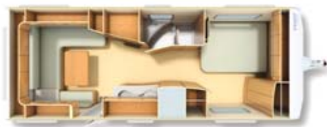
650 TBFS D