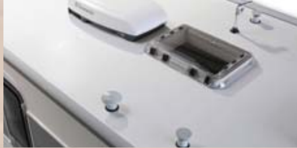
Pavillon LFI en fibre de verre renforcée anti-grêle