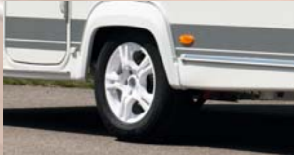
Jantes blanches pour une ligne parfaite