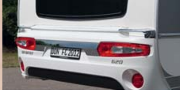
Exclusivité France: Nouveau pare-chocs