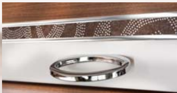
Incustrations Swarovski sur mobilier: charme et discrétion du luxe