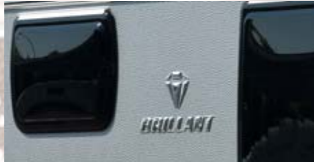
Brillant tout simplement