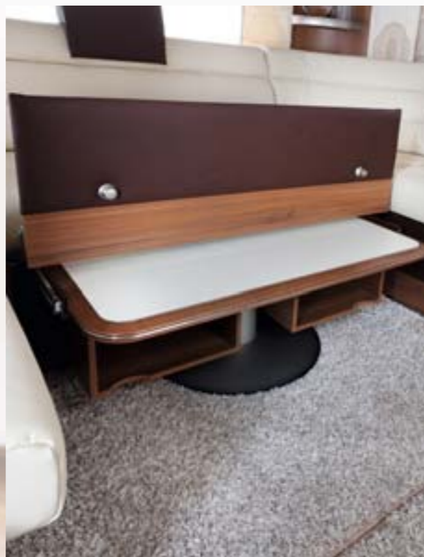
Exclusivité France: Table escamotable (Diamant, Brillant) La table à pied central réglable facilite l'accès au salon et libère l'espace. D'une optique moderne elle s'ajuste à la hauteur désirée et se range en un tour de main