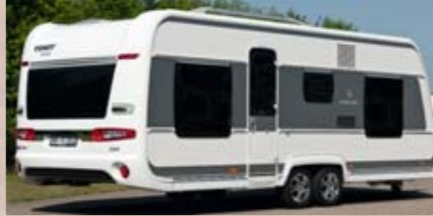
Faces avant et arrière technologie LFI (polyuréthane fibres longues injection) offrant stabilité et résistance