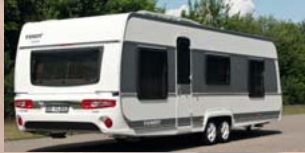
Exclusivité France: Nouveau design extérieur