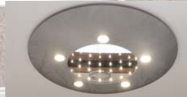
Plafonnier dôme module 3D