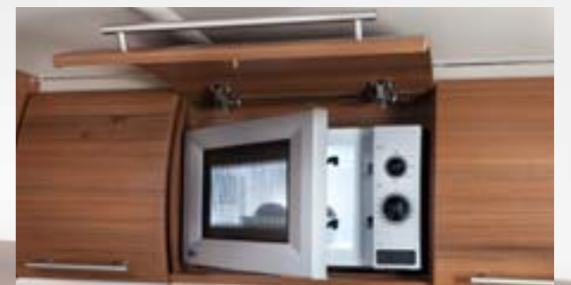
Four micro ondes: un gain de temps