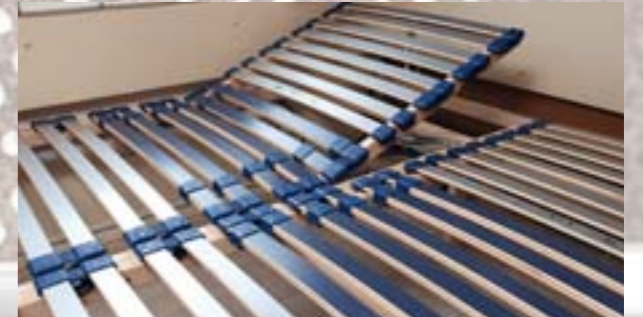
Sommiers à latte à double tête réglable et lattes articulées avec ponts d'articulation élastiques avec réglage de fermeté (Diamant, Brillant)