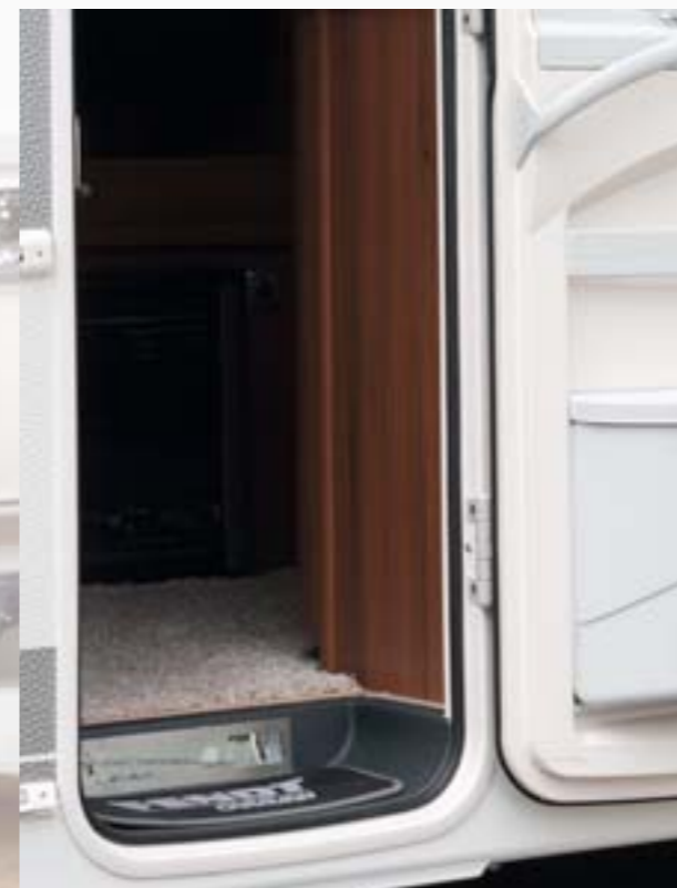
Eclairage LED intégré dans le marchepied pour une entrée sécurisée