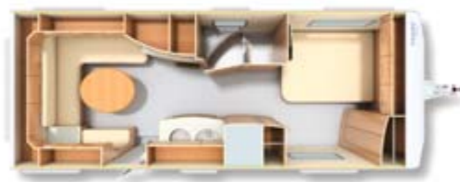
650 TBFS D