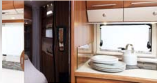
Réfrigérateur Slim-Tower 140 litres avec façade miroir (compartiment congélateur amovible et éclairage)