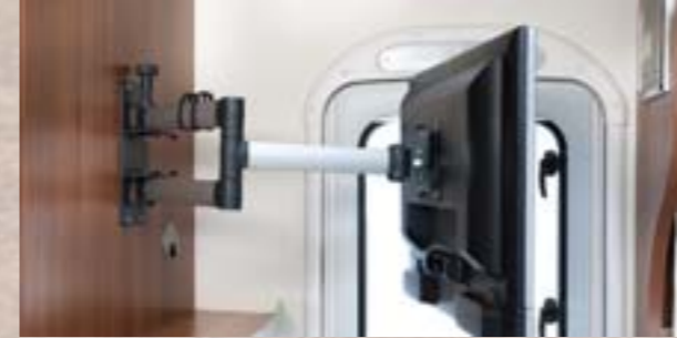
Support TV orientable: Selon modèle, est particulièrement pratique et s'est vu primé par le magazine spécialisé allemand « Camping, Cars & Caravans » (03/2010)