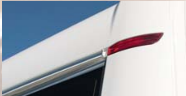
Combiné LED feux de gabarit et feux stop, sécurité oblige