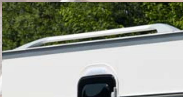
Barres de toit pour un fini irréprochable