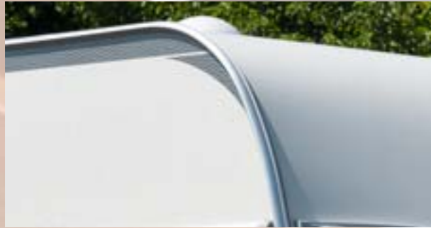
Exclusivité France: Toit Alufiber (résistance accrue aux chocs)