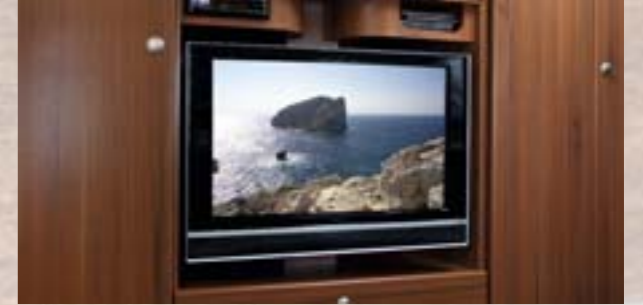
Médiathèque pour radio, TV écran plat 26", démodulateur et lecteur DVD